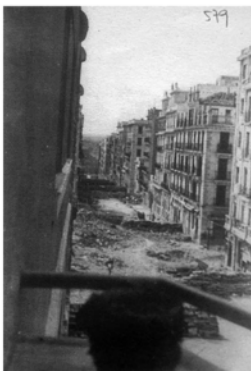
Madrid. Barricades. Carrer sense identificar.

Les imatges de Barcelona i Madrid que trobarem a l'exposició, com poden ser fotografies de carrers preses després d'un bombardeig, reproduccions de cartografies, imatges de cartells d'ambdues ciutats, edificis enderrocats a causa de les bombes, etc., posen de manifest una simetria, de vegades, literal. Són situacions anàlogues que trenquen amb la rivalitat històrica i que agermanen les dues ciutats.