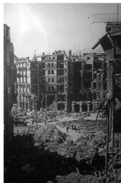
Barcelona. Conseqüències del bombardeig Del 17 de març de 1938 a la Gran Via.