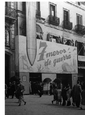
Barcelona. Exposició 7 MESOS DE GUERRA

L'exposició s'engloba dins el cicle anual Espanya podria ser diferent , una mirada sobre Espanya des de Catalunya: quines són les bases que ens han portat a ser com som; quines eren les tendències fa 30 anys que, si haguessin arrelat, ens haurien portat a ser diferents; i quines són les anàlisis o propostes sobre el territori que expliquen com podria ser. Així, l'exposició Madrid-Barcelona: dues ciutats sota les bombes presenta un passat que explica part del que som avui.