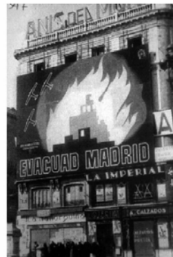
Madrid. Cartell EVACUAD MADRID. Puerta del Sol.