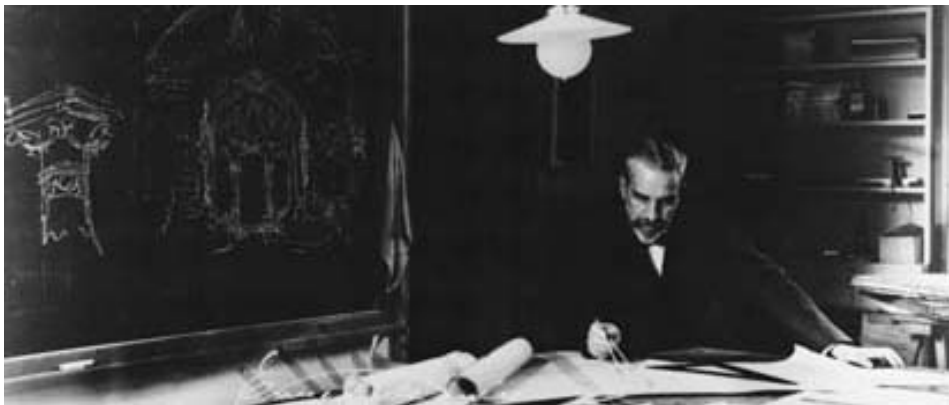
Foto: Enric Sagnier i Villavecchia al seu estudi d'arquitectura