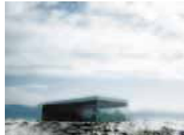
Decosterd & Rahm